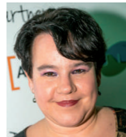
Sharon Dijkma, Staatssecretaris EZ