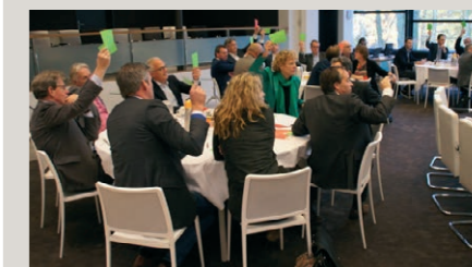
CEO ontbijt op 22 november bij de SER in Den Haag

Het Duurzaam betonakkoord is een initiatief van MVO Nederland. Het is een initiatief voor (koploper) bedrijven, brancheleden hebben Cascade gevraagd mee te denken. Met name CO2-reductie en hergebruik van gerecyclede materialen in beton (betongranulaat) zijn de belangrijke onderwerpen van gesprek. Tijdens zogenaamde CEO-ontbijten wordt gestemd over te ondernemen stappen.